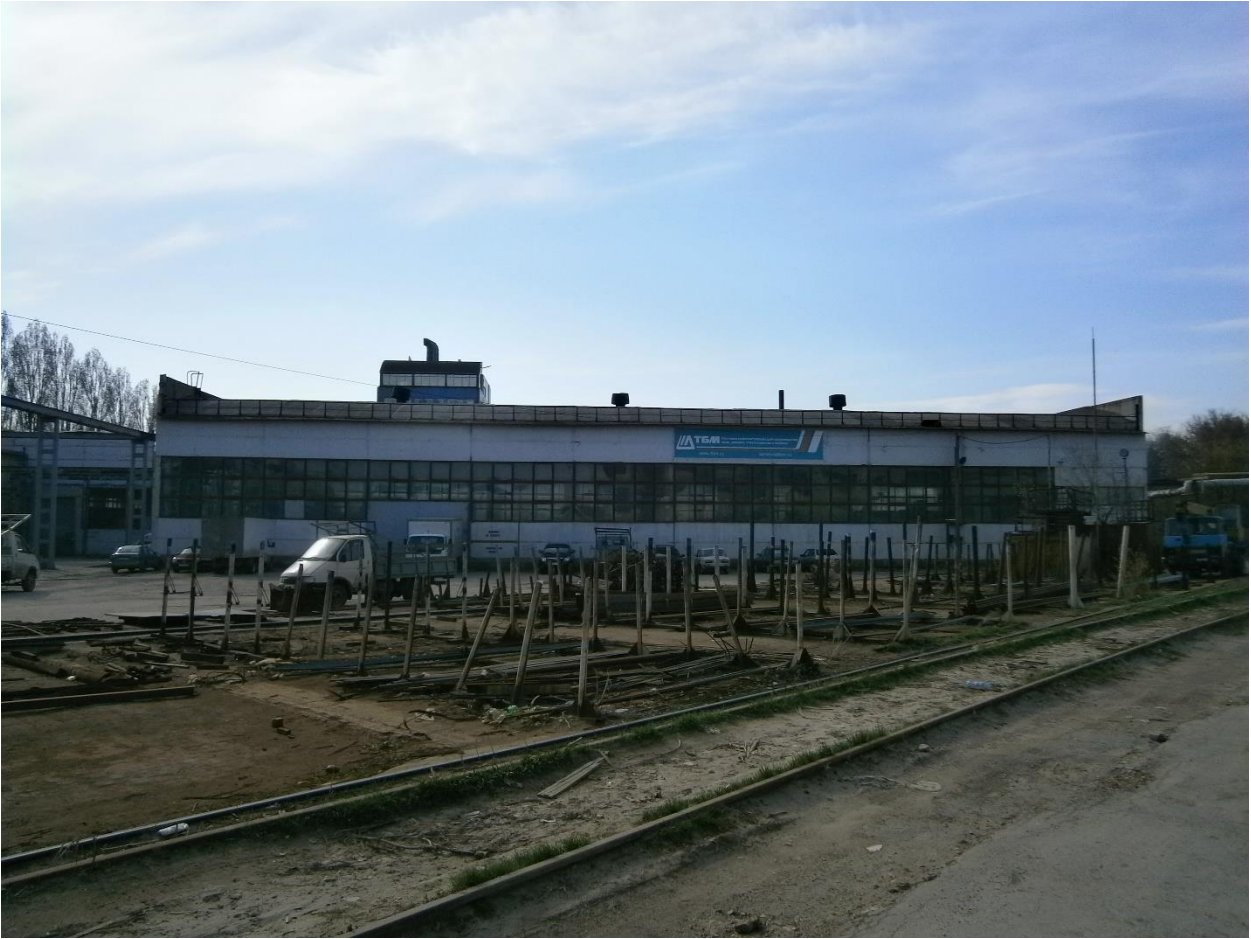
4. Вход в здание с торца.